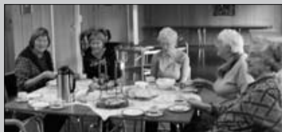
Det er trivelig å gjøre en innsats for menighetsbladet!

I 30 år har frivillige i menigheten gått med menighetsbladet. En stor takk til alle ombærere.