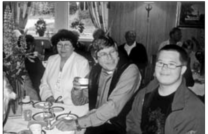
Familien Røgeberg koser seg.